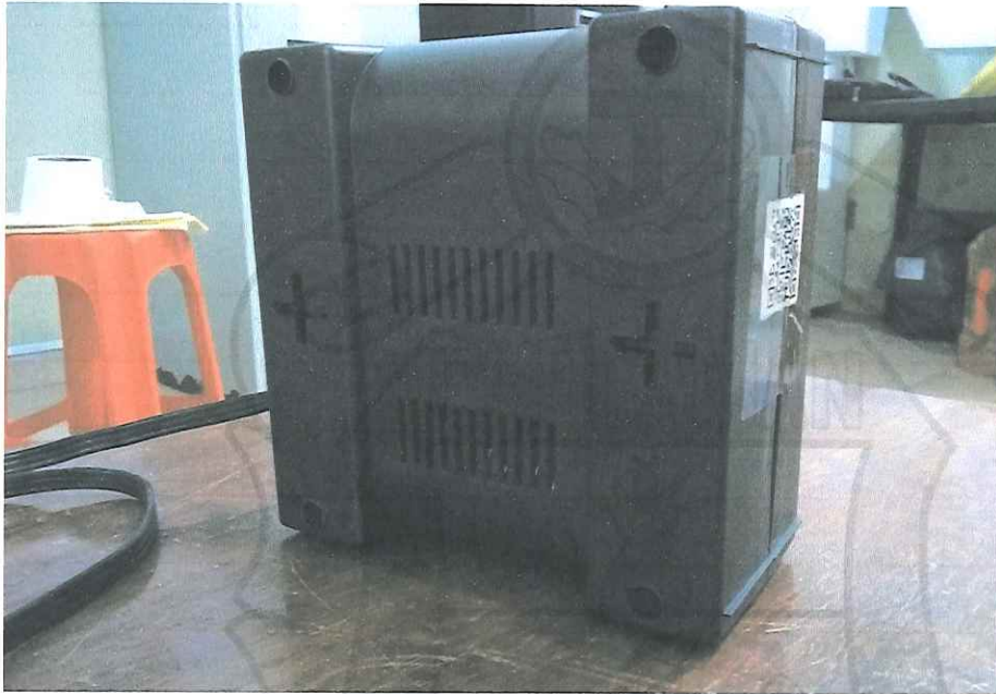
Regulador de voltaje SMARTBITT 1200VA/600W 4 CONTACTOS