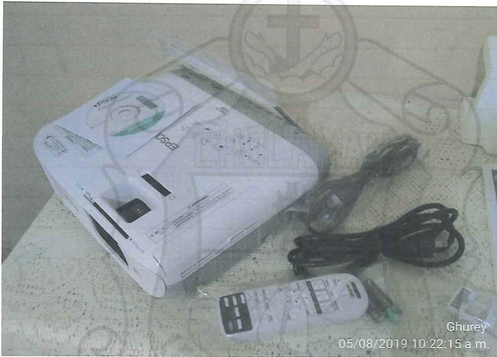
Proyector POWERLITE X39 XGA 3LCD

[Handwritten signature] Instituto Municipal de las Fuerzas Armadas de Chocamán, Ver. Administración 2018-2021