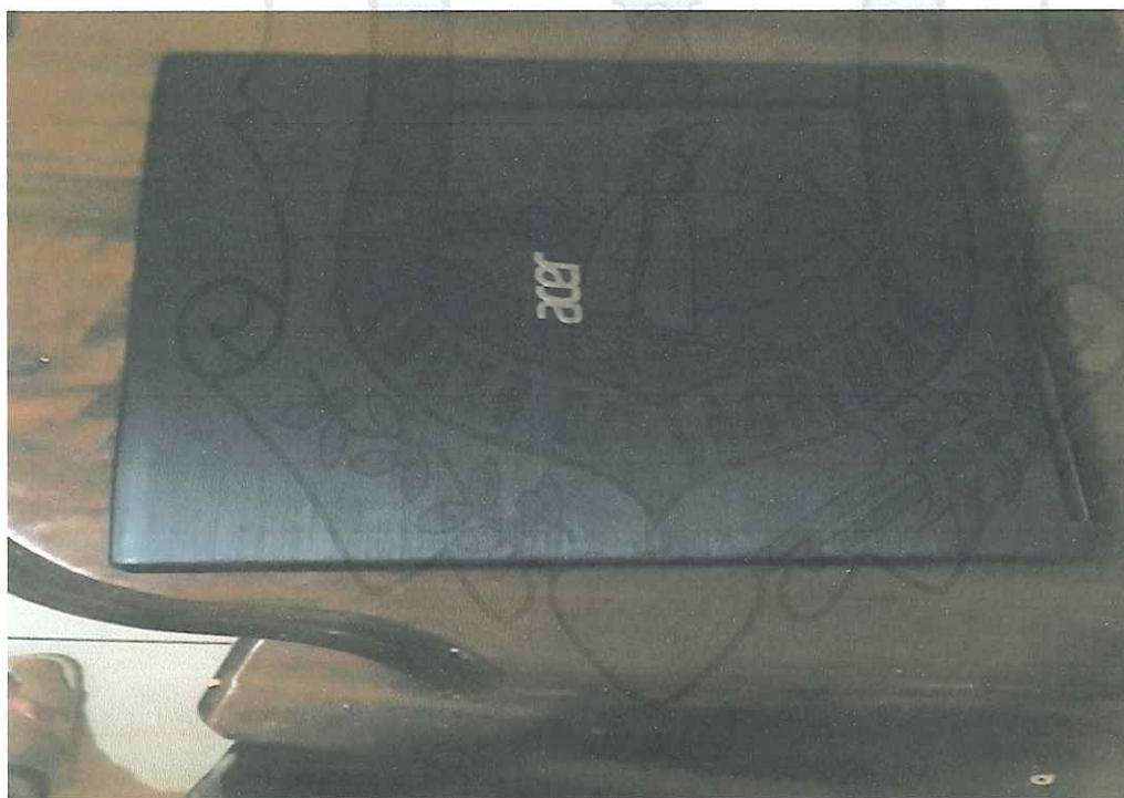
Computadora portátil acer A315-53-517D, procesador Intel Core 15.

*Este equipo pasara a ser parte del Patrimonio y uso exclusivo del Instituto Municipal de las Mujeres de Chocamán, Ver