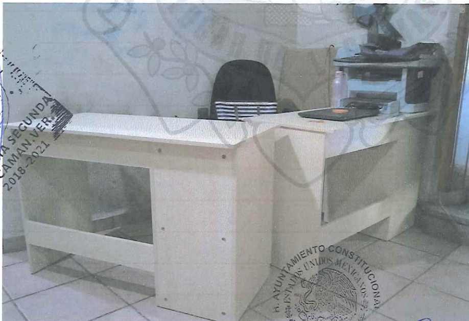
Escritorio para computadora con gabinete o D2038 APF